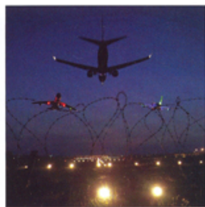
▲◀ Dalla mostra Contemporary World.

Galleria Magenta 52, via Crocefisso 2/a, 20871 Vimercate MB tel. 039-660768 fax 039-660768 e-mail: magenta52@dima-design.it info@dima-design.it web: www.dima-design.it