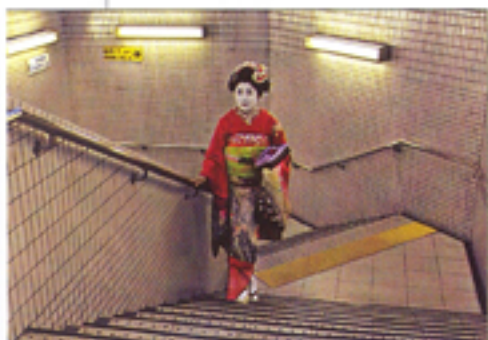
▲ Geisha nella metropolitana, Tokyo, Giappone, 2008.

Vista l'ampia cover story dedicata a Steve McCurry sullo scorso numero, spendiamo giusto qualche parola per rappresentare l'omonima mostra collegata e attualmente allestita presso il MACRO Testaccio di Roma