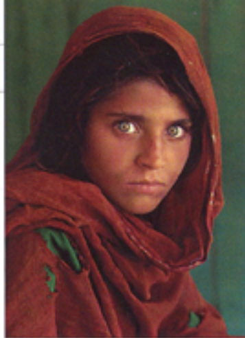
▲ Sharbat Gula, ragazza afgana al campo profughi di Nasir Bagh vicino a Peshawar, Pakistan, 1984.

(piazza Orazio Giustiniani 4). Si tratta infatti di un ampio percorso espositivo che comprende oltre duecento fotografie da lui realizzate in oltre trent'anni di carriera: dal celebre ritratto della ragazza afgana dagli occhi verdi a tutte le altre immagini divenute nel corso del tempo vere e proprie icone. Una selezione effettuata non tanto sulla base di criteri spazio-temporali, quanto per assonanza di soggetti e di emozioni. Un allestimento che si presenta dunque quasi come un villaggio nomade, con una serie di volumi che si compenetrano tra loro nel tentativo di restituire quel senso di umanità che, da sempre, contraddistingue le foto di McCurry, diventando il suo inconfondibile marchio di stile. Oltre alle foto più celebri, entrerà a far parte di questo articolato percorso anche una selezione delle sue fotografie italiane, un magnifico omaggio all'Italia, realizzato