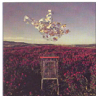
▲▼ Dalla mostra Contemporary World, foto di Stefano Parrini.

MACRO Testaccio - La Pelanda, piazza Orazio Giustiniani 4, 00153 Roma; tel. 06-0608 web: www.stevemccurryroma.it